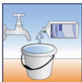
Produkt mit Wasser 1:10 verdünnen

Nach der Einwirkzeit fährt man den Bodenbelag mit einer Einscheibenmaschinen unter Verwendung eines weißen oder roten Pads ab. Die Schmutzflotte muss sofort mit einem Wasserauger abgesaugt werden. Anschließend muss der Belag mit klarem Wasser gespült werden. Nach ca. 15 Min. Trockenphase kann man den Bodenbelag wieder betreten.