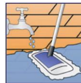
Mit frischem Wasser gut nachspülen.