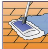
Boden nassfeucht wischen.