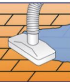
Absaugen der Schmutzflotte