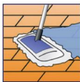
Boden feuchtnass einlegen.